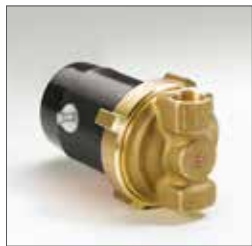
Typ PRO 15-1/65

Die neuen ecocirc® PRO Trinkwasser-Zirkulationspumpen haben gegenüber der bisherigen Version E1vario einen automatischen Entlüftungsmodus, eine Stand-by-Schaltmöglichkeit, eine LED-Betriebsanzeige und serienmäßig eine Wärmedämmschale.