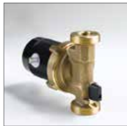
Typ PRO 15-1/110