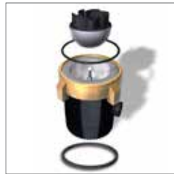
Typ PRO 1M