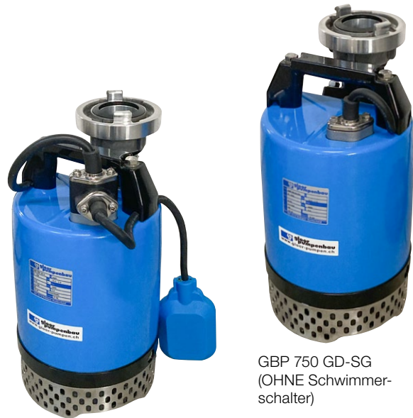
GBP 750F GD-G (MIT Schwimmerschalter)