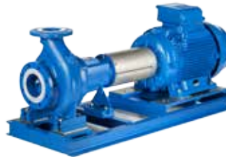
NSCF / NSCC

Grundplattenausführung Bauform B3 einschließlich Ausbaucupplung und wahlweise mit Instrumentenstand für Druckanzeigeeinstrumente