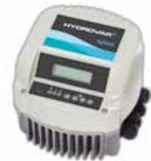
NSC.. mit Hydrovar

Je nach Anwendung mit Drucktransmitter oder Differenzdrucktransmitter, ausgestattet mit Anti-Kondensations-Heizvorrichtung