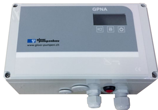
Alarmschaltgerät GPNA mit Akkumulator