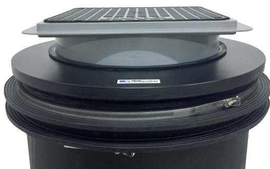
Geruchsdichte Abdeckung. Höhenverstellbares Aufsatzstück. Auftriebsicherung und Mauerkragen.